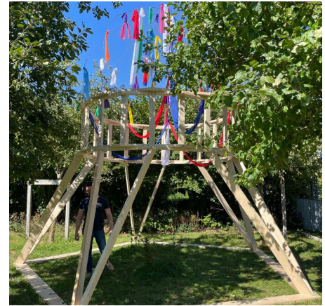
Le Toit Commun - Collectif Mulot / Jardin des plantes