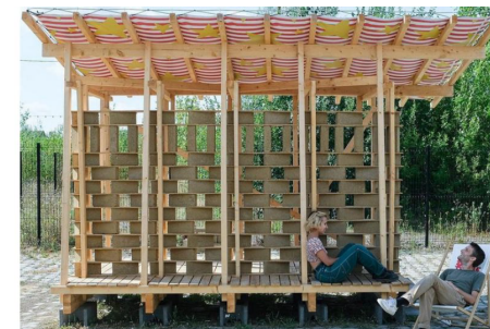
Le Kiosque - Quatraine + Atelier Post / Bazaar-St-So