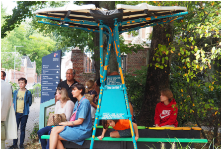
Le Barrièoptère - Les Saprois + Université Catholique de Lille Croisement rue du Port et bld Vauban, Vauban Esquermes