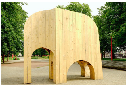
Back to nature - Collectif Exercise / Parc Jean-Baptiste Lebas