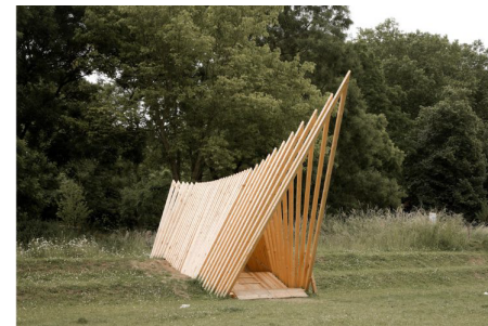
L'éventail - Collectif Yamago / Parc Barbusse, Faubourg de Béthune