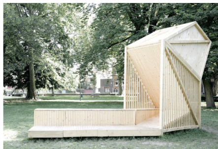
Des racines à la Cime - Agence La pluie / Square Lardemer