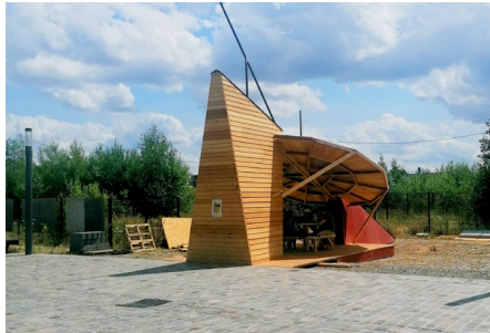
Latitude 50.62° - Atelier LMA + Comapgnons du devoir et du tour de France / Bazaar-St-Sto