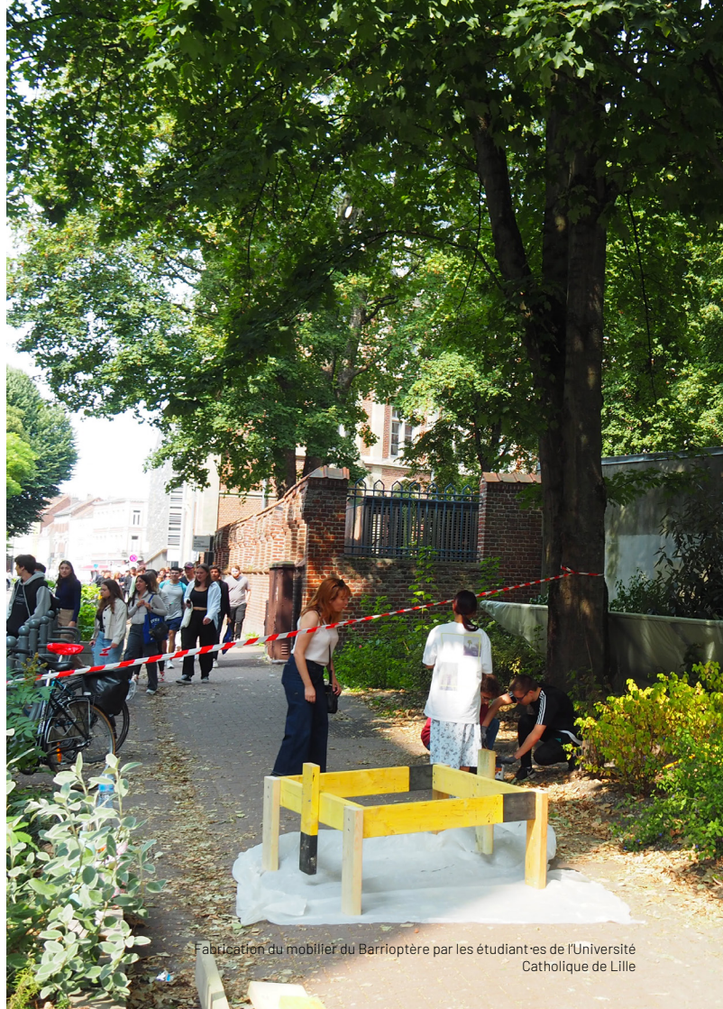
Fabrication du mobilier du Barrioptère par les étudiant-es de l'Université Catholique de Lille

Les propositions des lauréat-es incluront une réflexion sur le lien avec les associations, les structures socio-culturelles et les habitant-es du quartier. Une démarche concernant la dimension participative et inclusive devra être présentée. Toutes ces actions permettront d'évaluer les besoins et enjeux du site et du quartier dans lesquels les cabanes seront localisées. Un temps d'inauguration de la cabane sera organisé, pour inviter les habitants à fêter l'arrivée de la nouvelle infrastructure. En 2023, le WAAO a mis en place des chantiers avec les Compagnons du Devoir , des jeunes des centres sociaux et d'autres associations locales.