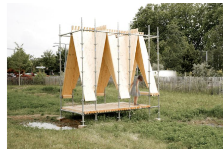
Alliage - EM.B0 architecture / Grand Sud