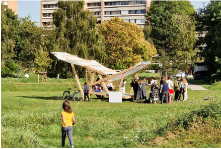
Mille Plateaux - Collectif Mezza/ Parc Barbusse, Faubourg de Béthune