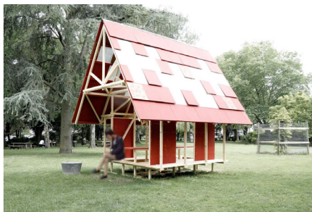
Le Toit Commun - Collectif Mulot / Jardin des plantes