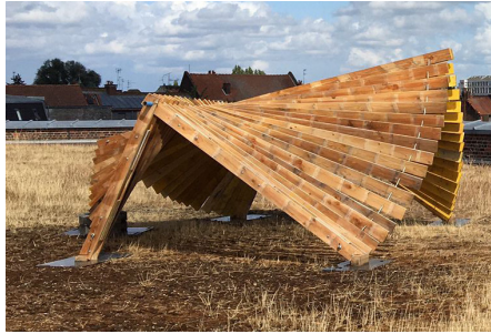
Starship - Quatine + Atelier Post + la Condition Publique / Condition Publique